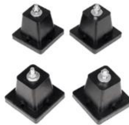
סט 4 רגליים גומי למזגן גדול שחקים