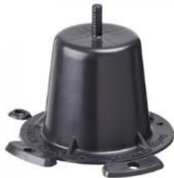
סט 4 רגליים פלסטיק למזגן Twitoplast