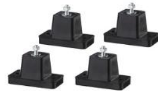
סט 4 רגליים גומי למזגן קטן שחקים

דרוש לנתק את המנועים ולהנחת את תשובות גומי :